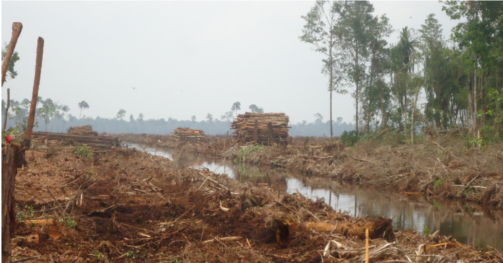
Foto: tumpukan kayu alam di tepi kanal usai ditebang (18/10/2014).

gambut untuk dijadikan kanal. Satu alat berat berhenti bekerja, dua alat berat lainnya sedang menebang hutan alam.