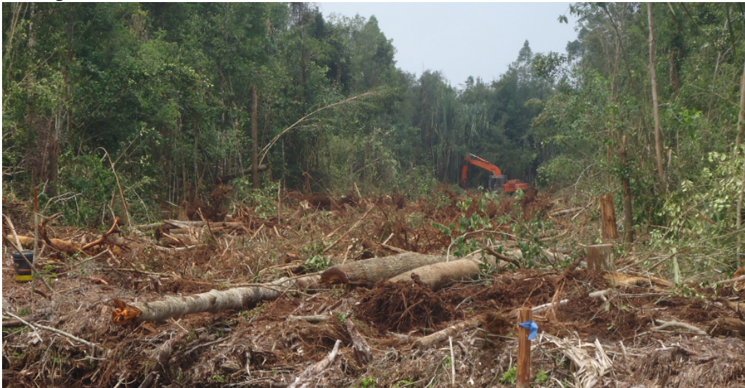
Foto: alat berat sedang menghancurkan kayu alam di Desa Bagan Melibur, (18/10/2014).

APRIL terus melakukan penebangan hutan alam di Pulau Padang dengan berdalih bahwa Pulau Padang tak masuk dalam studi HCVF APRIL.