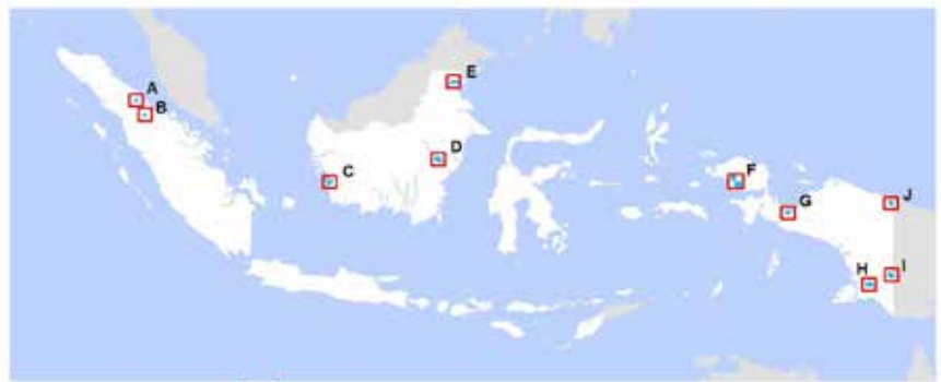
Concessions in case studies A PT. PP London Sumatra Indonesia Tbk: - Gunung Malaya Estate D PT. PP London Sumatra Indonesia Tbk: - Kedang Estate - Pahu Estate - Itey Estate F 1. PT. Perwata Patara Mandiri - Blok I and II 2. PT. Fytora Maringgai Perkasa 3. PT. Vario Mitra Andalan I PT. Papua Agro Lestari B PT. PP London Sumatra Indonesia Tbk: - Sei Rambaya Estate E PT. Persada Kencana Prima G PT. Nabire Baru J PT. Tondir Santa Papua C PT. Arta Energy Resources H PT. Dongin Prabawa

Banyak dari perusahaan tersebut adalah anggota RSPO. Hal ini menimbulkan lebih banyak lagi pertanyaan tentang peran RSPO dalam menghentikan penghancuran hutan hujan Indonesia. Hal ini juga merupakan pengingat jelas bahwa keanggotaan RSPO bukanlah jaminan praktik keberlanjutan, atau bahwa suatu perusahaan mematuhi kebijakan 'non-deforestasi'.